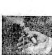
Lămpi de buzunar în funcțiune